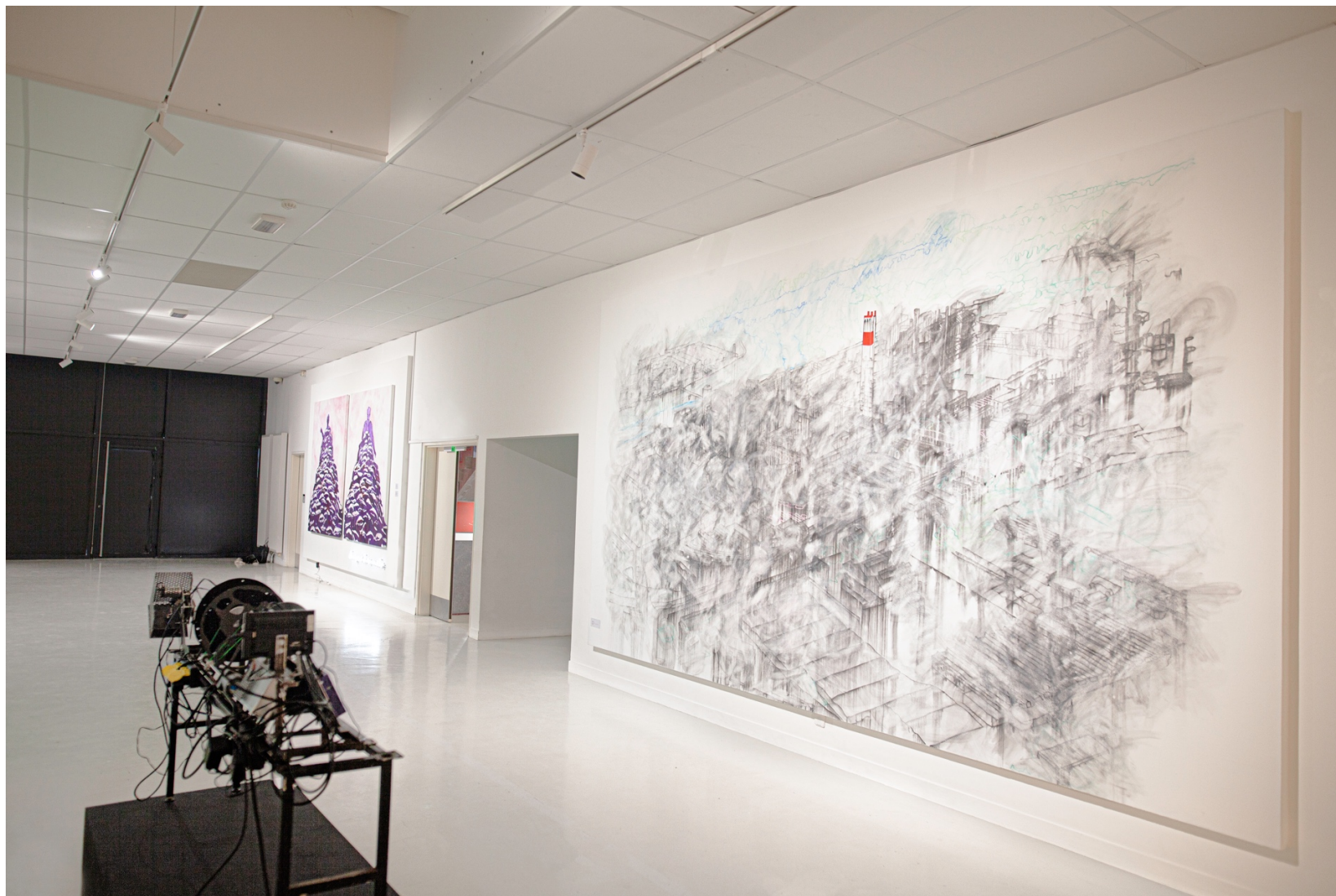
Vue de l'exposition BLAST, La Fabrique, Toulouse, du 18 janvier au 24 février 202

Conçu in situ pour La Fabrique, Toulouse, dans le cadre de l'exposition BLAST. Protocole