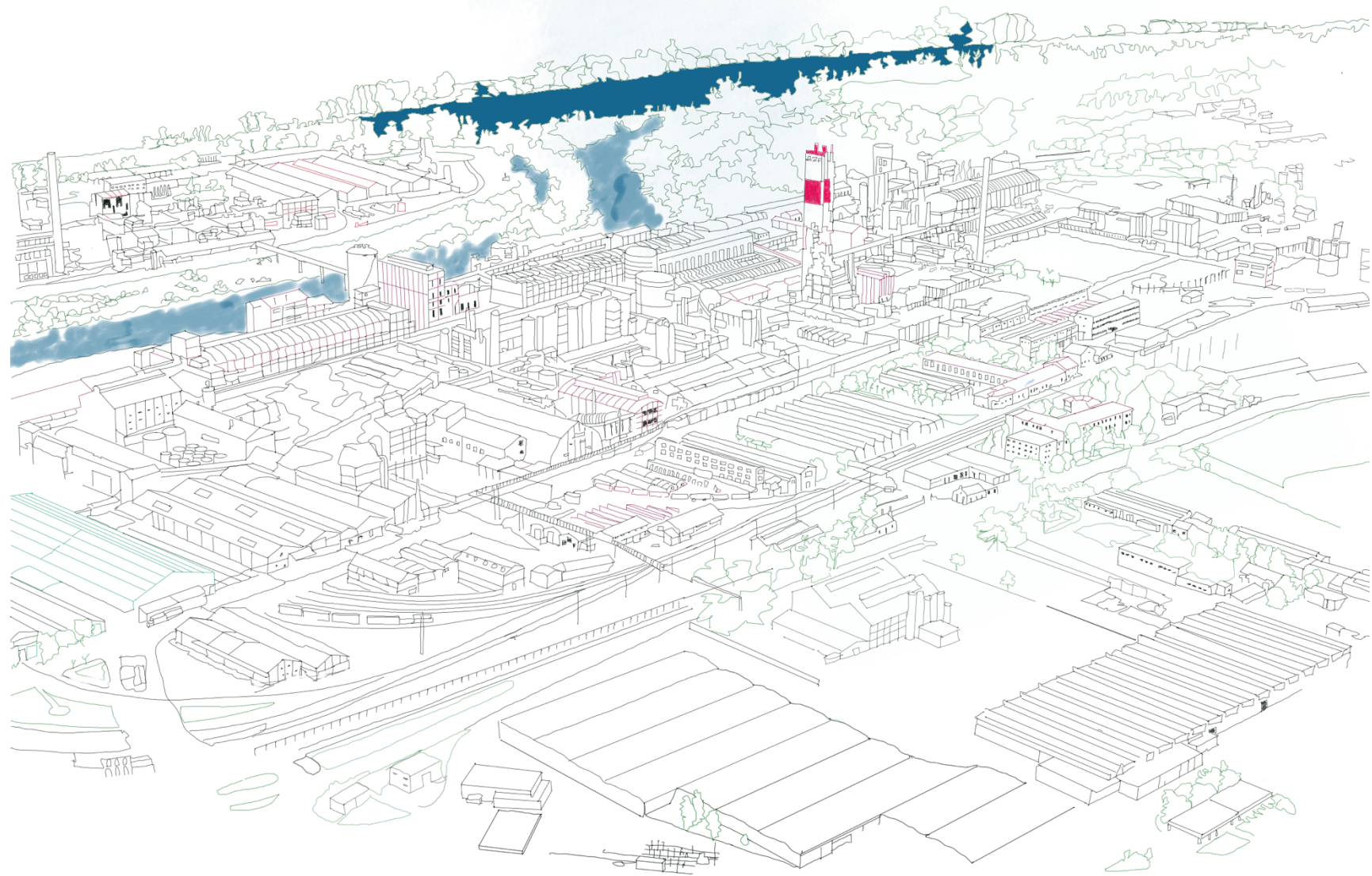
Rayer de la carte, 2024. Dessin-matrice initial.